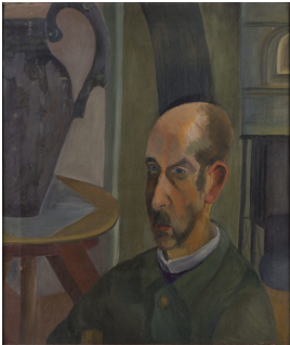
© Katharina Heise