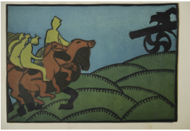
© Katharina Heise Foto: Salzlandkreis, Salzlandmuseum